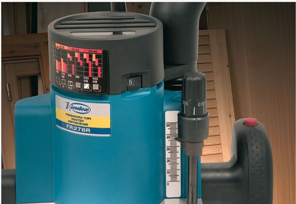
Variateur de vitesse électronique.