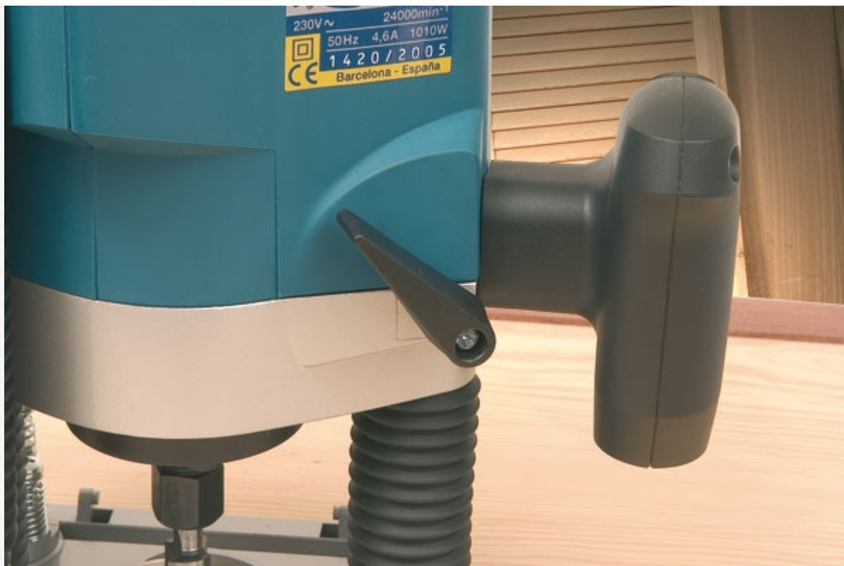
Lévier de blocage de la tête à proximité de la poignée.