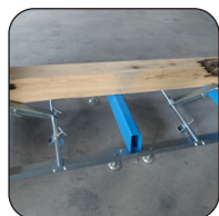
Système de maintien de grume