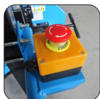
Bouton d'arrêt d'urgence