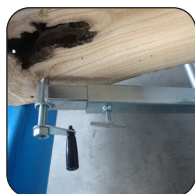
Système de maintien de grume