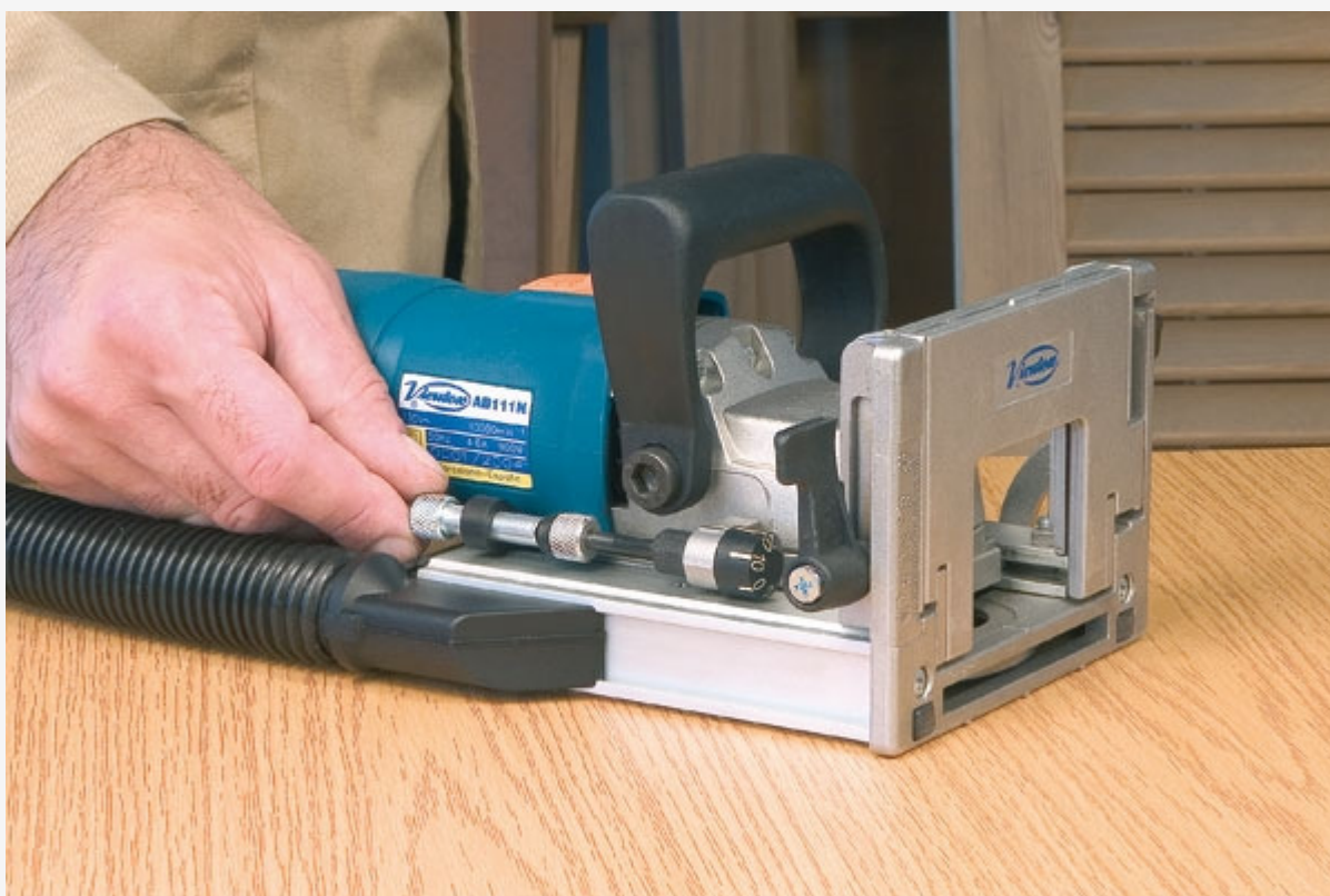
Réglage rapide des différentes profondeurs de fraisage.