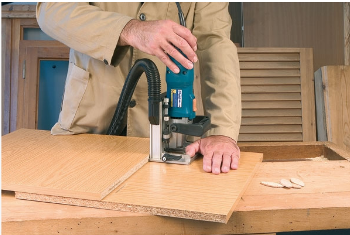
Assemblage en milieu de panneau