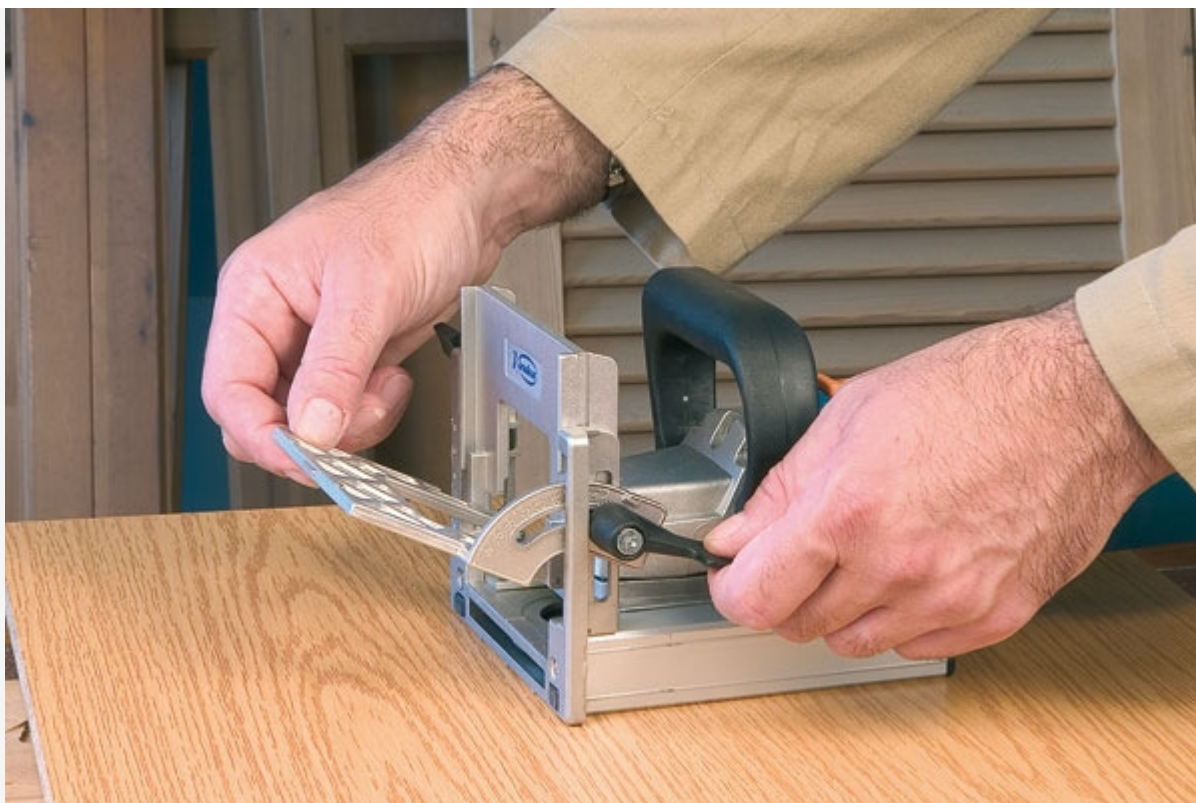
Guide frontal réglable en angle et en hauteur avec échelles graduées