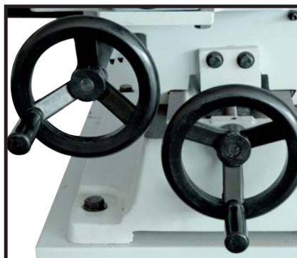
Double chariotage latéral et longitudinal sur queue d'aronde Horizontal and lateral movement on dovetail