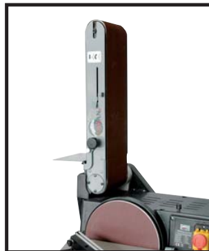
Bande orientable de 0° à 90° Belt sander operates horizontally and vertically, from 0° to 90°