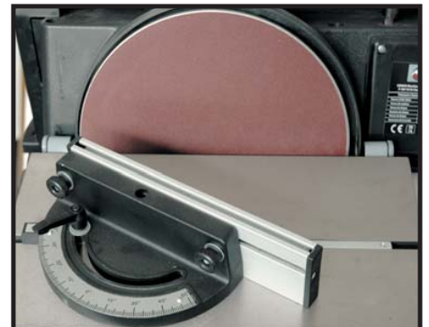
Guide d'onglet Miter gauge