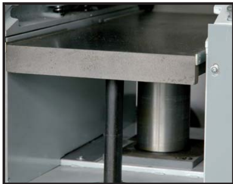
Table de rabotage montée sur 2 fûts Thicknesser table set on 2 supports