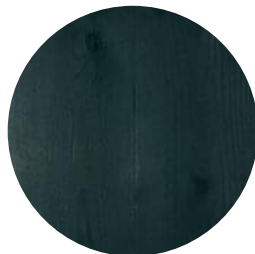
RUBIO MONOCOAT GREEN