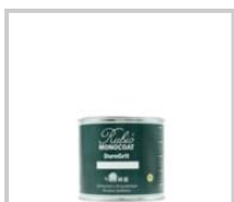
Boîte 500 ml