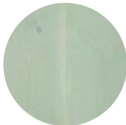
SALT LAKE GREEN