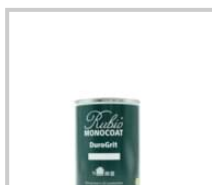
Boîte 1 L